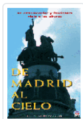
DE MADRID AL CIELO AGROMAYOR