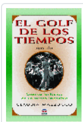
GOLF DE LOS TIEMPOS (NOVELA) MAZZUCCO