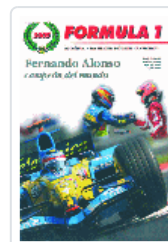
FORMULA 1 (2005) FERNANDO ALONSO:CAMPEON DEL MUNDO D'ALESSIO ; STIRANO ; VAN ELDIK ; MARSH