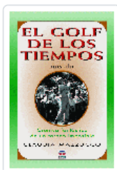
GOLF DE LOS TIEMPOS (NOVELA) MAZZUCCO