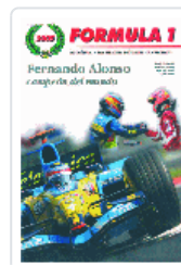
FORMULA 1 (2005) FERNANDO ALONSO: CAMPEON DEL MUNDO D'ALESSIO ; STIRANO ; VAN ELDIK ; MARSH