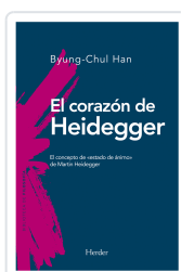
EL CORAZÓN DE HEIDEGGER HAN, BYUNG-CHUL