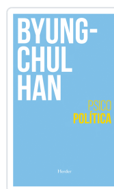
PSICOPOLÍTICA 2/E HAN, BYUNG-CHUL