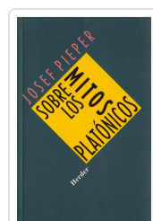
SOBRE LOS MITOS PLATONICOS PIEPER, JOSEF