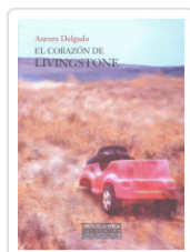
CORAZON DE LIVINGSTONE DELGADO, AURORA