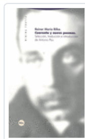
CUARENTA Y NUEVE POEMAS RILKE, RAINER MARIA