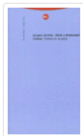
ADIOS A EMMANUEL LEVINAS DERRIDA, JACQUES