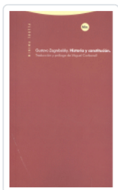
HISTORIA Y CONSTITUCION 2/E ZAGREBELSKY, GUSTAVO