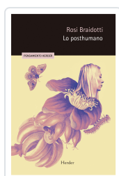
Lo posthumano Braidotti, Rosi