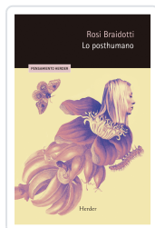
Lo posthumano Braidotti, Rosi