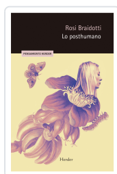
Lo posthumano Braidotti, Rosi