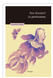
Lo posthumano Braidotti, Rosi