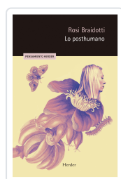
Lo posthumano Braidotti, Rosi