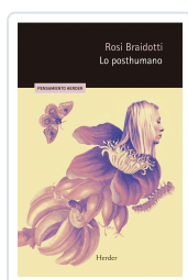
Lo posthumano Braidotti, Rosi