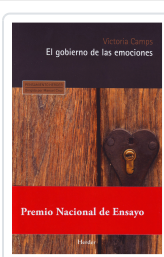
GOBIERNO DE LAS EMOCIONES, EL CAMPS, VICTORIA