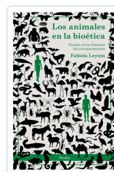
ANIMALES EN LA BIOETICA, LOS LEYTON, FABIOLA