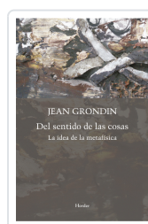
DEL SENTIDO DE LAS COSAS GRONDIN, JEAN