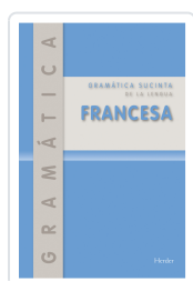
FRANCES GRAMÁTICA SUCINTA (NE) KORDGIEN, G.