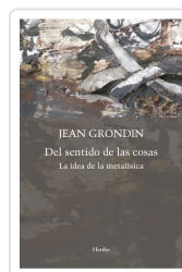
DEL SENTIDO DE LAS COSAS GRONDIN, JEAN