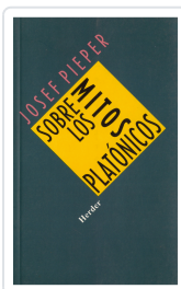
SOBRE LOS MITOS PLATONICOS PIEPER, JOSEF