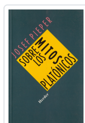
SOBRE LOS MITOS PLATONICOS PIEPER, JOSEF