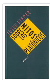
SOBRE LOS MITOS PLATÓNICOS PIEPER, JOSEF