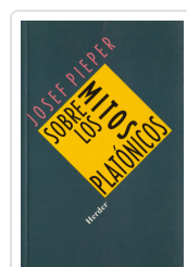
SOBRE LOS MITOS PLATONICOS PIEPER, JOSEF