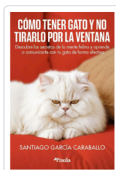
COMO TENER GATO Y NO TIRARLO POR LA VENTANA GARCIA CARABALLO, SANTIAGO