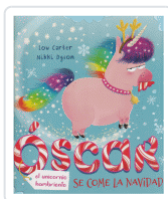
OSCAR EL UNICORNIO HAMBRIENTO SE COME LA NAVIDAD CARTER / DYSON