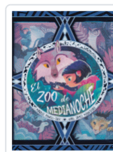
ZOO DE MEDIANOCHE POWELL-TUCK / MOUNTFORD