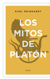
MITOS DE PLATÓN REINHARDT, KARL