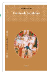
CUENTOS DE LOS RABINOS ALBA, AMPARO