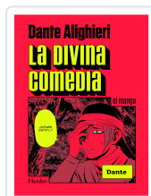
DIVINA COMEDIA, LA (MANGA) (DESC) ALIGHIERI, DANTE