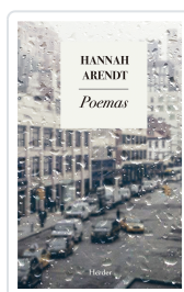
POEMAS. HANNAH ARENDT ARENDT, HANNAH