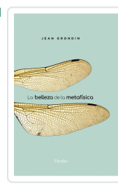
BELLEZA DE LA METAFISICA GRONDIN, JEAN