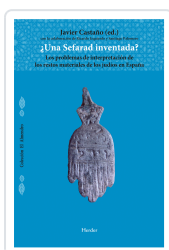
?UNA SEFARAD INVENTADA? CASTAÑO, JAVIER