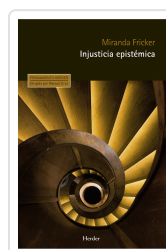
INJUSTICIA EPISTEMICA FRICKER, MIRANDA