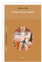
CUENTOS DE LOS RABINOS ALBA, AMPARO