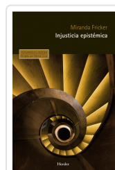
INJUSTICIA EPISTEMICA FRICKER, MIRANDA