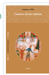
CUENTOS DE LOS RABINOS ALBA, AMPARO