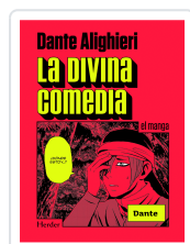
DIVINA COMEDIA, LA (MANGA) (DESC) ALIGHIERI, DANTE