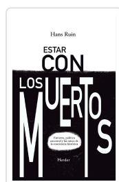
ESTAR CON LOS MUERTOS Ruin, Hans