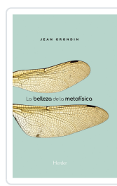
BELLEZA DE LA METAFISICA GRONDIN, JEAN