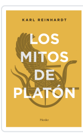
MITOS DE PLATON REINHARDT, KARL