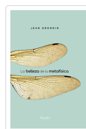
BELLEZA DE LA METAFISICA GRONDIN, JEAN