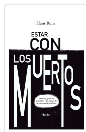
Estar con los muertos Ruin, Hans