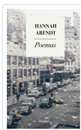
POEMAS. HANNAH ARENDT, HANNAH