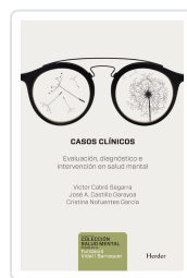
CASOS CLINICOS CABRE, VICTOR