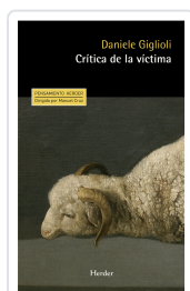
CRITICA DE LA VÍCTIMA GIGLIOLI, DANIELE