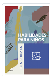
HABILIDADES PARA NIÑOS FURMAN, BEN