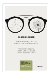
CASOS CLINICOS CABRE, VICTOR