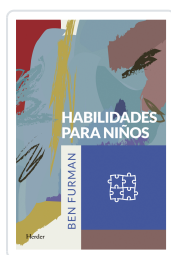
HABILIDADES PARA NIÑOS FURMAN, BEN