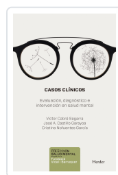
CASOS CLINICOS CABRE, VICTOR