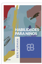
HABILIDADES PARA NIÑOS FURMAN, BEN