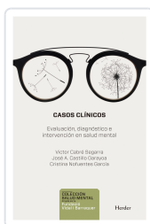
CASOS CLINICOS CABRE, VICTOR