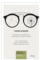
CASOS CLÍNICOS CABRE, VÍCTOR