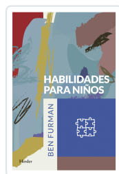
HABILIDADES PARA NIÑOS FURMAN, BEN