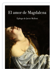
AMOR DE MAGDALENA, EL (NE) ANONIMO (RILKE)