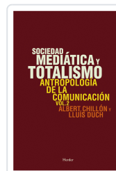
SOCIEDAD MEDIÁTICA Y TOTALISMO DUCH, LLUIS