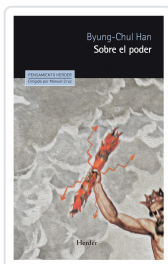
SOBRE EL PODER HAN, BYUNG-CHUL