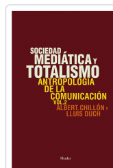
SOCIEDAD MEDIÁTICA Y TOTALISMO DUCH, LLUIS