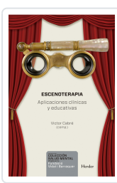
ESCENOTERAPIA CABRE, VICTOR