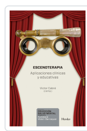
ESCENOTERAPIA CABRE, VICTOR