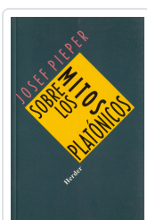
SOBRE LOS MITOS PLATONICOS PIEPER, JOSEF