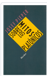
SOBRE LOS MITOS PLATONICOS PIEPER, JOSEF