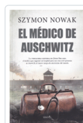
MEDICO DE AUSCHWITZ NOWAK, SZYMON