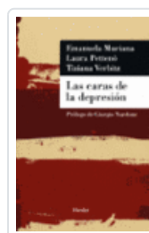
CARAS DE LA DEPRESION, LAS MURIANA, EMANUELA