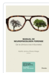
MANUAL DE NEUROPSICOLOGIA FORENSE JARNE, ADOLFO