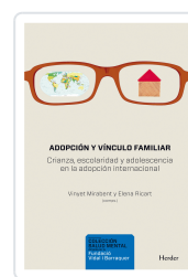
ADOPCION Y VINCULO FAMILIAR MIRANBET, VINYET