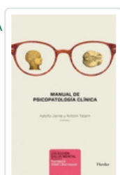
MANUAL DE PSICOPATOLOGIA CLINICA (DESC) TALARN, ANTONI