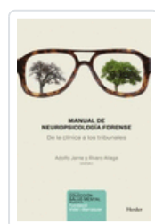
MANUAL DE NEUROPSICOLOGIA FORENSE JARNE, ADOLFO