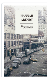
POEMAS. HANNAH ARENDT, HANNAH