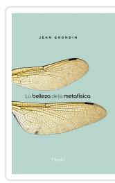
BELLEZA DE LA METAFISICA GRONDIN, JEAN