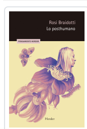
Lo posthumano Braidotti, Rosi