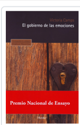
GOBIERNO DE LAS EMOCIONES, EL CAMPS, VICTORIA