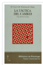
TÁCTICA DEL CAMBIO, LA FISCH, RICHARD